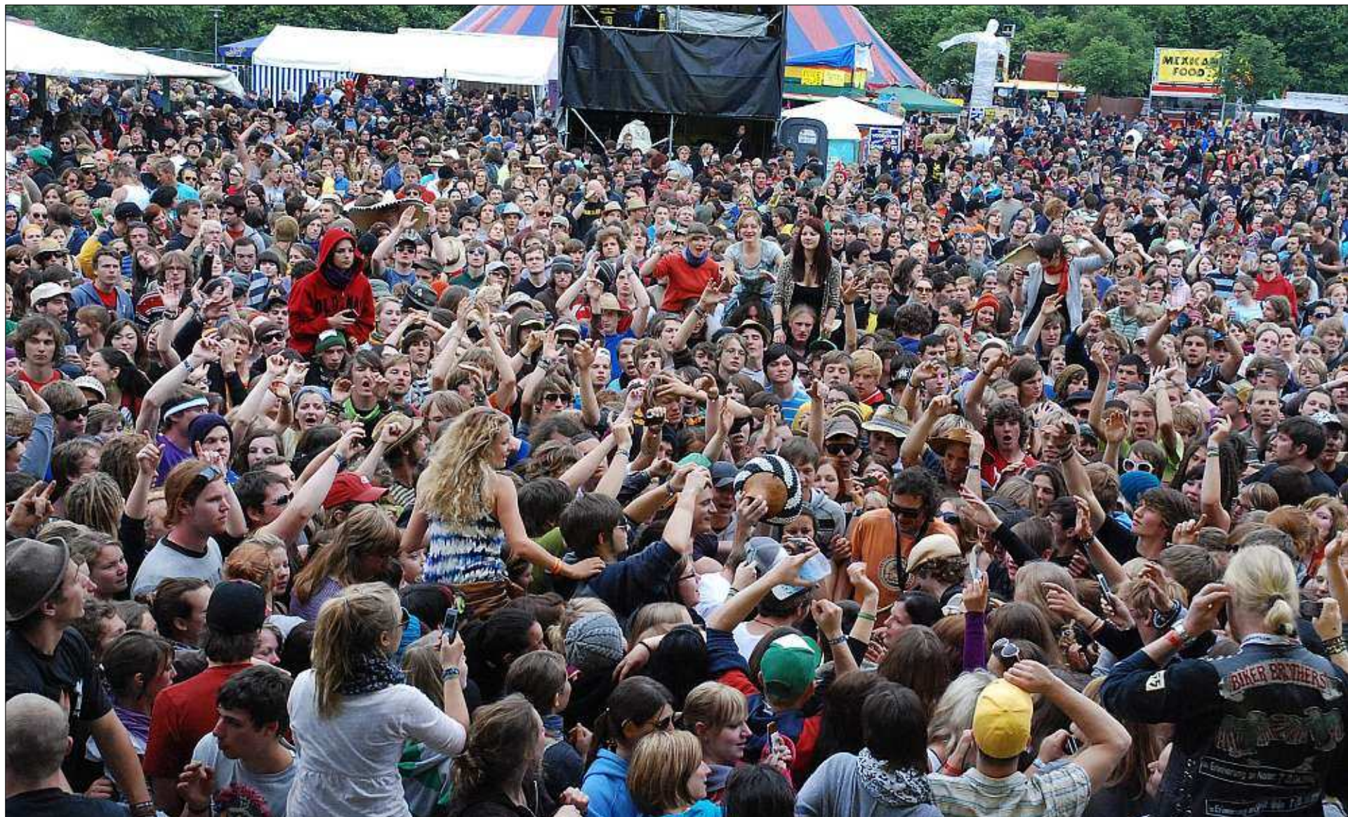
Seit neun Jahren finden jeweils an Pfingsten tausende junge Leute den Weg nach Hauzenberg, hier eine Szene heuer vom Pfingstsonntag. Die Frage stellt sich jedes Jahr neu: Kann man an den drei Tagen und Nächten den Anwohnern den Lärm zumuten, der aus diesem Fest entsteht? Der Stadtrat hat diese Frage erneut bejaht und damit das zehnte Open Air in Hauzenberg für 2010 genehmigt.

Hauzenberg: Redaktion: ☎ 0 85 86/97 27 21, Fax: 97 27 25, E-Mail: red.hauzenberg@pnp.de Geschäftsstelle: ☎ 0 85 86/97 27 70, Fax: 97 27 25 Öffnungszeiten: Mo. bis Do. 8–12.30 u. 13–16 Uhr, Fr. 8–13 Uhr