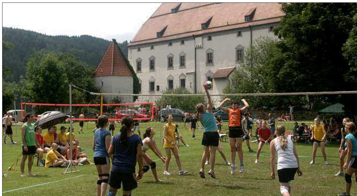
Hier war die Volleyballwelt im Schlossgarten noch in Ordnung. Mit viel Einsatz wurde um die Punkte gekämpft, bis gegen 16 Uhr der starke Regen das Turnier stoppte.

Bei den Damen wäre das Finale Fürstzell 2 gegen Fürstzell 1 gewesen, die Teilung des Siegerpokals fiel hier leicht. Die weiteren